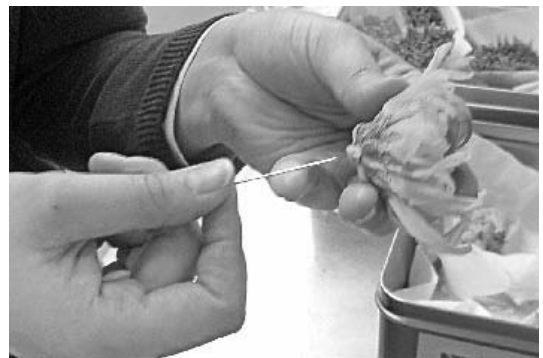
花は、強く握るとくずれてしまうのでやさしく扱う