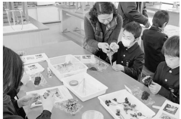
生徒のアイデアを大切に