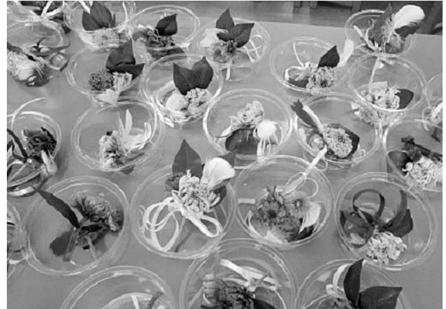
完成後は、ふた付きの容器に乾燥剤を入れて保存する