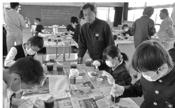
各班に必ず1人は補助者が付くこと