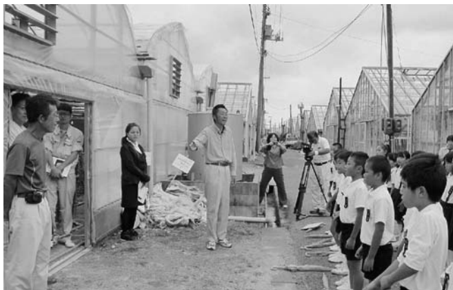
キク農家でキクの作り方を学ぶ