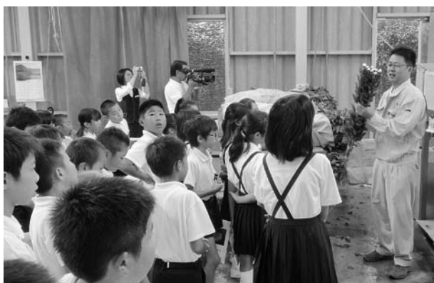
JA職員からキクの出荷方法について学ぶ