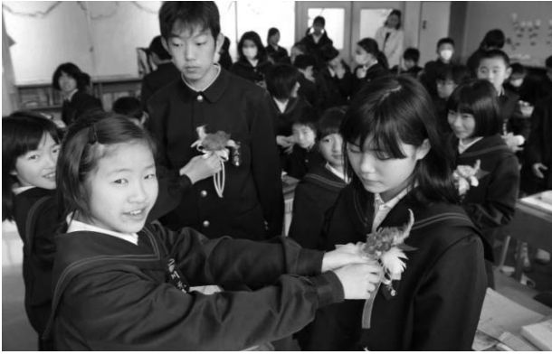
ついに迎えた卒業式での着用