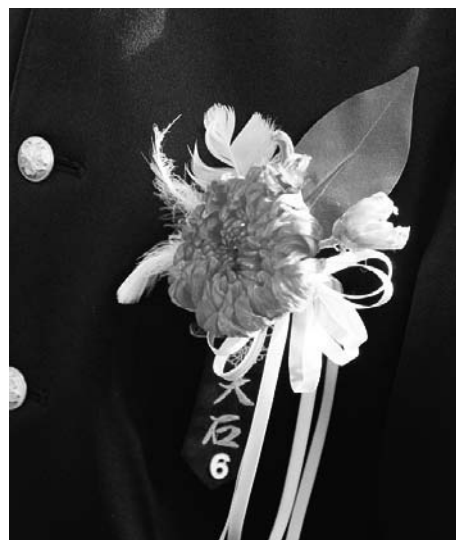
卒業生の胸を飾るコサージュ