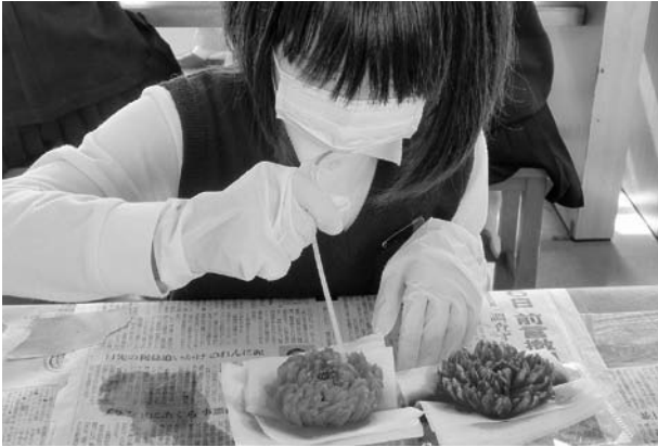
のり付けは、時間をかけ細かく丁寧に