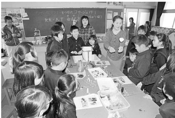
怪我に注意しながらみんなで楽しく作業する