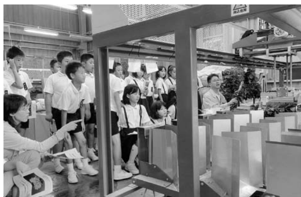
キクを自動で選花する機械を見学