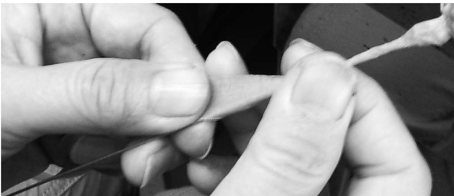
固定用の針金にフローラテープを巻くと美しく仕上がる