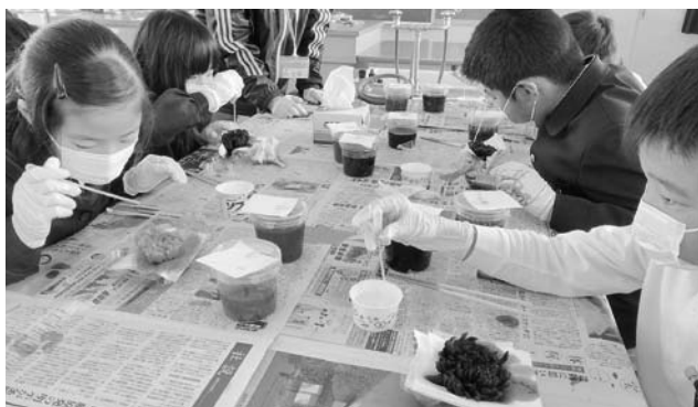
のり付け作業（必ずマスク、手袋を着用）

補助者もプリザーブドフラワー作りが初めてという方が多いので、事前に作業内容や手順を確認しておく、当日スムーズに補助ができる。