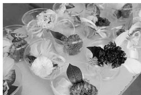
鮮やかな色に仕上がったコサージュ