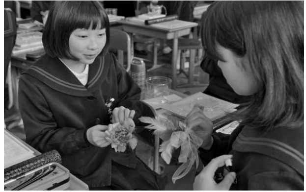
送った4年生も送られた卒業生も感動