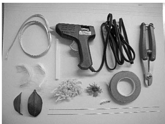
コサージュ作成資材一式