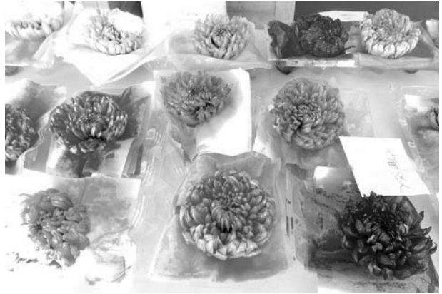
きれいに染め上がった白輪ギク