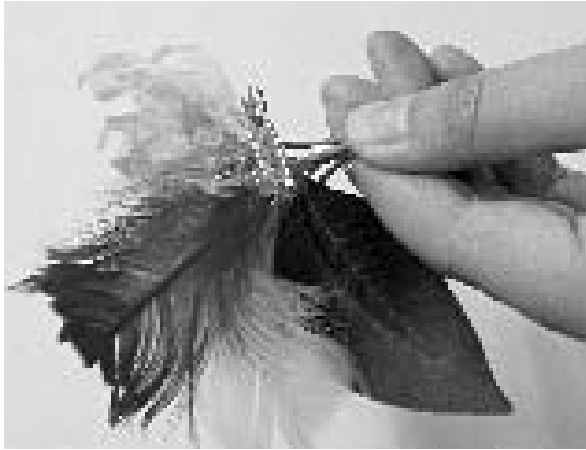
羽や葉を添えると豪華な仕上がりになる