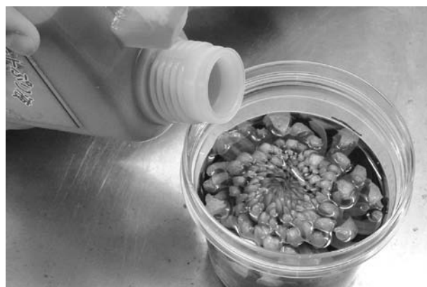
花の大きさに合った、最小限の容器を選ぶと良い。 （染色液が少なくすみ経済的）