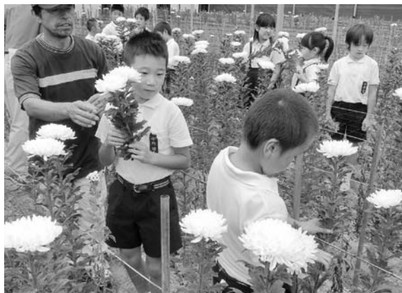
プリザーブドフラワーに使用する白輪ギク (咲かせ過ぎ、花が開き過ぎていない方が良い)