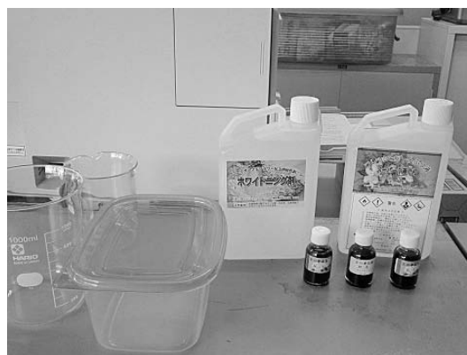
プリザーブドフラワー作成資材一式